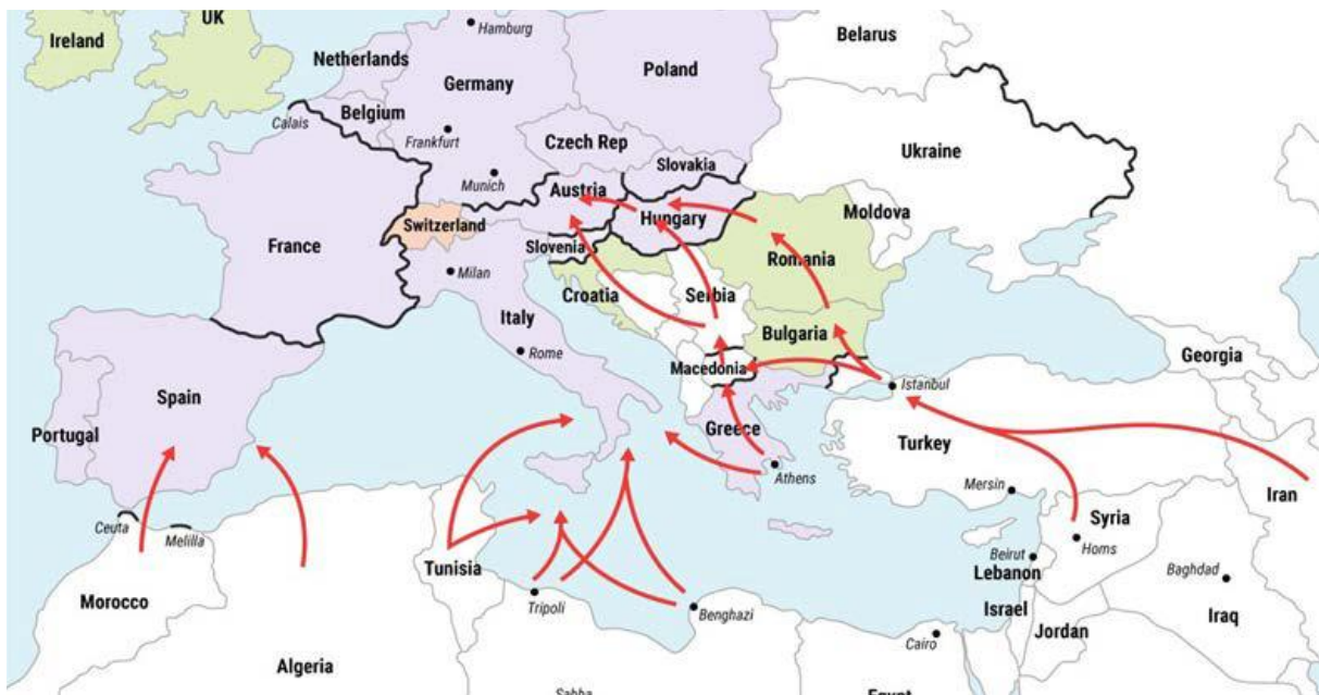
Figure 1 (voies transit migratoires)