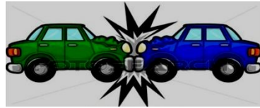
الشكل 4: التمثيل البياني لمعضلة الجبان