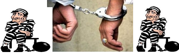
الشكل 1: تمثيل معضلة السجين