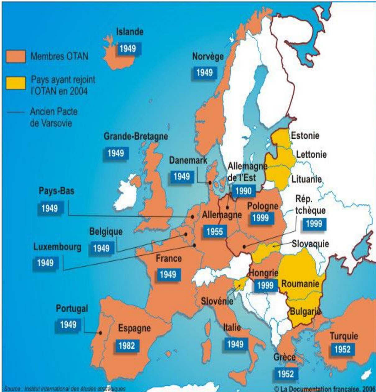
Carte géopolitique des 26 membres de l'OTAN